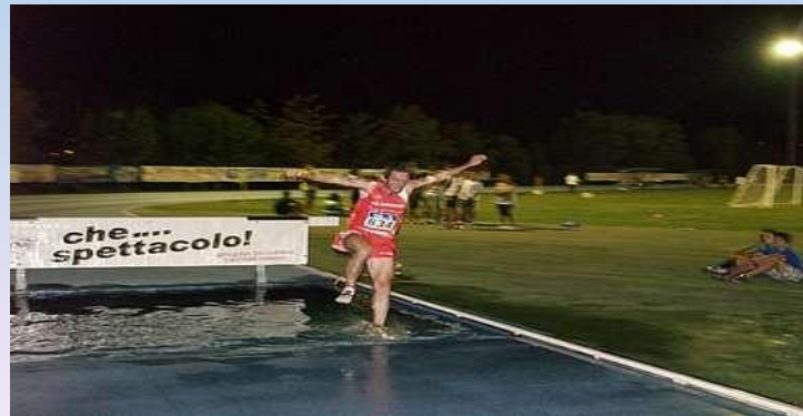
Gruppo Tecnico UGN