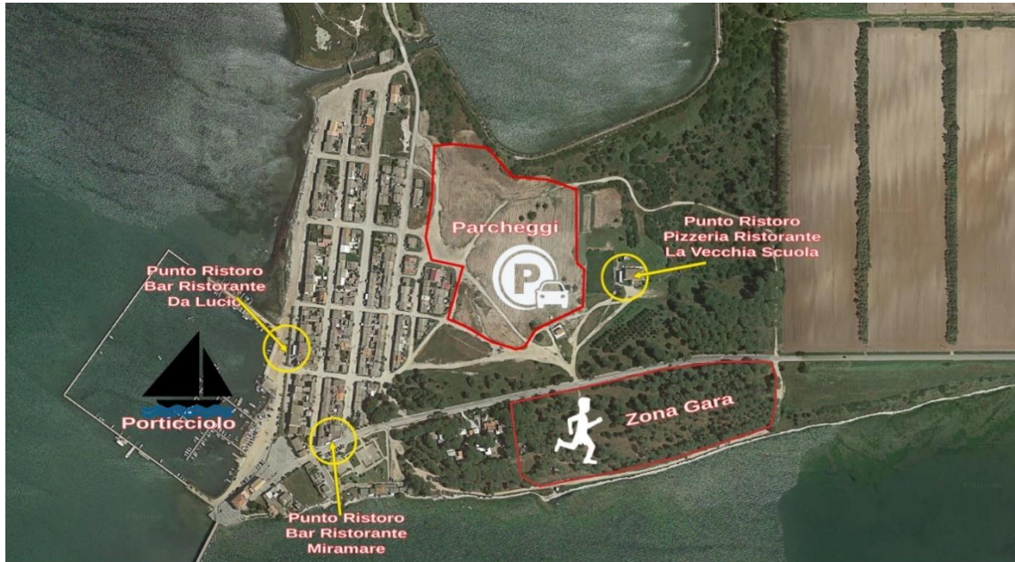
03 Marzo 2024 - 5° Prova del Festival del Cross Campionato Regionale Del Cross - Loc. Marceddì (Terralba)

Sede Sociale: Via Napoli, n° 3 – 09098 – TERRALBA (OR) e-mail: amatoriterralba@yahoo.it PEC: amatoriterralba@pec.it ☎ 340/6501819 – 393/9272159 Codice Fiscale: 90025610958