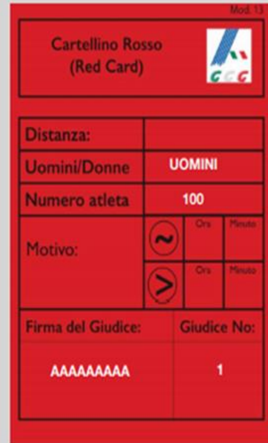
Manca ORA E MOTIVO