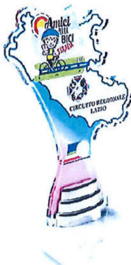
#161 | Trofeo in plexi trasparente personalizzato