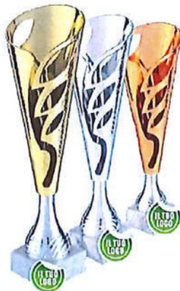
#187 | Trofeo personalizzabile, misure e colori disponibili: h. oro 34,5cm h. argento 32,5cm h. bronzo 30cm