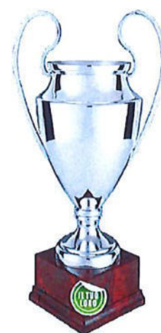
#207 | Trofeo personalizzabile, misure disponibili: 44 / 48 / 52 / 57 / 61cm