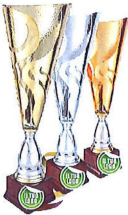
#202 | Trofeo personalizzabile, colori e misure disponibili: h. oro: 58cm / h. argento: 52cm / h. bronzo: 47cm