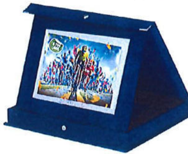
#155 | Targa in astuccio slim 21x17cm