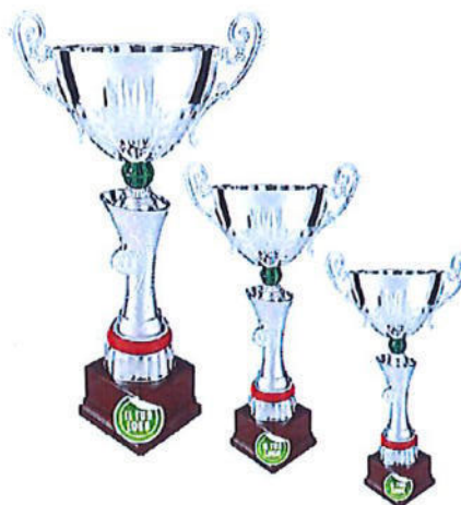
#188 | Trofeo personalizzabile h. 32cm/ 36,5cm/ 40,5cm