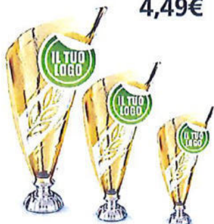
#176 | Trofeo oro personalizzabile h 24,5cm