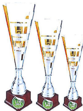
#198 | Trofeo argenteo/oro personalizzabile, misure disponibili: h. 36 / 38 / 43cm