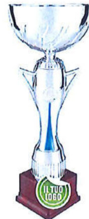
#201 | Trofeo bicolore personalizzabile h. 33,5cm / 38cm / 42,5cm