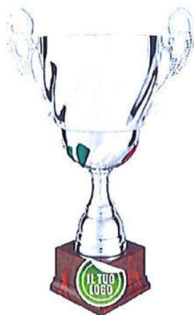
#194 | Trofeo argenteo con tricolore personalizzabile, misure disponibili: h. 38,5 / 43 / 48 cm