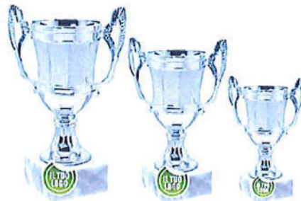
#174 | Coppa personalizzabile, misure disponibili: h 16cm, 18cm, 20cm