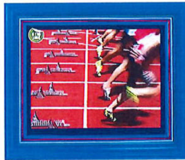
#158 | Targa blu con cornice in legno tricolore, Interno 20x25cm