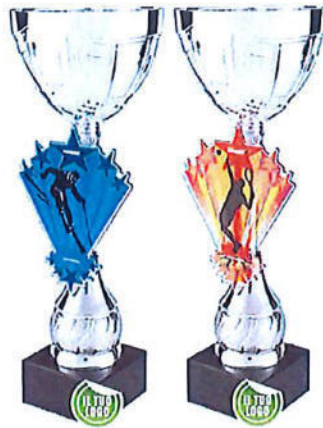
#182 | Trofeo personalizzabile con discipline sportive, misure disponibili: h. 24 / 26,5 / 29,5 / 33/ 35,5 cm