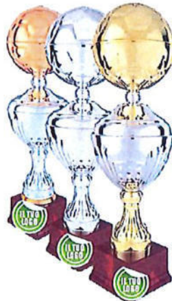
#203 | Trofeo calcio personalizzabile misure e colori disponibili: h. oro 61cm / h. argento: 54cm / h. bronzo: 50cm