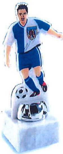
#160 | Trofeo in plexi bianco personalizzato