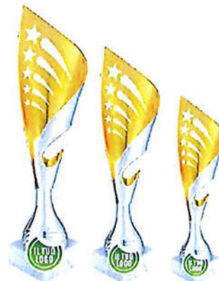
#180 | Trofeo personalizzabile oro/argento, misure disponibili: h 30cm, 32,5cm, 34,5cm