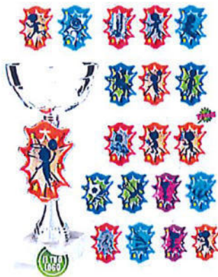
#184 | Trofeo con pannello personalizzabile con discipline, misure disponibili: h. 20,5/22/24/27 cm