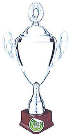
#191 | Trofeo argenteo con manici e coperchio personalizzabile: misure disponibili: 39 / 44 / 49 / 52 cm