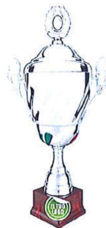
#195 | Trofeo argenteo con tricolore e coperchio personalizzabile, misure disponibili: h. 48 / 53 / 61 cm