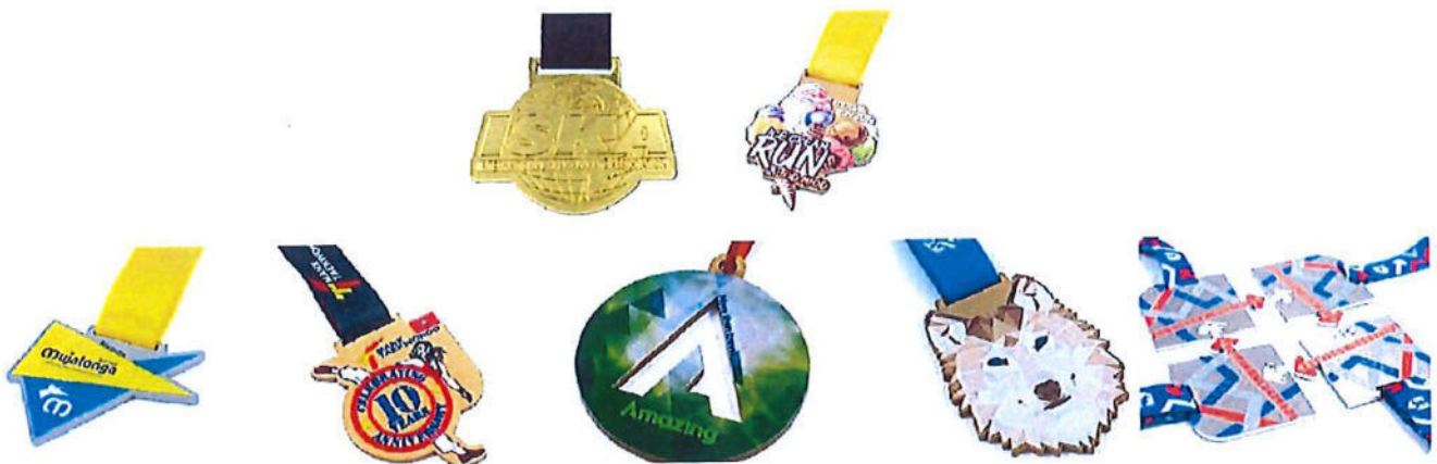
#169 | Medaglia in ferro personalizzata, realizzabile in qualsiasi forma e dimensione