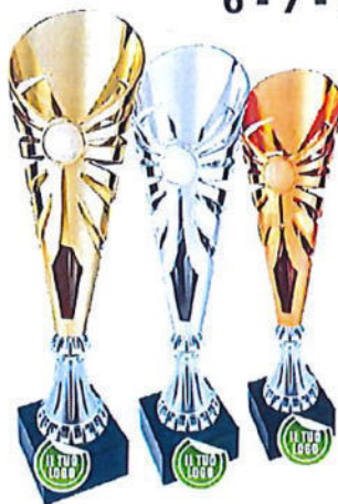
#179 | Trofeo personalizzabile: Bronzo: h 35,5cm Argento: h 37cm Oro: 38,5cm