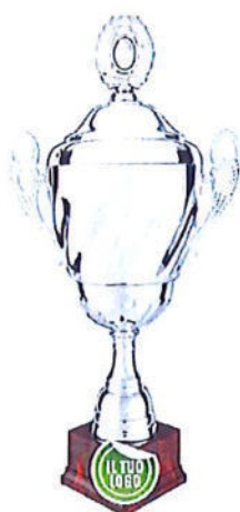
#193 | Trofeo argenteo con coperchio personalizzabile misure disponibili: 43 / 48 / 53 / 61 cm