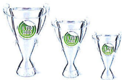
#177 | Coppa personalizzabile, misure disponibili: 19,5 cm, 22cm, 24,5cm