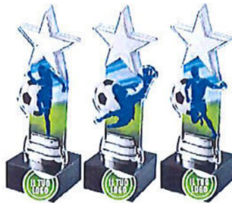
#185 | Trofeo star personalizzabile con discipline sportive