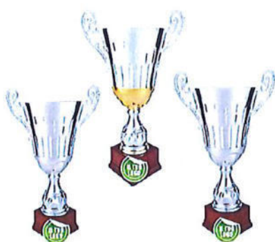
#196 | Trofeo argenteo personalizzabile, colori e misure disponibili: h. oro: 53cm h. argento: 47cm h. bronzo: 42,5cm