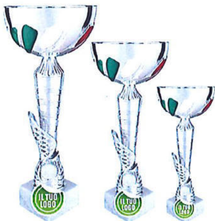
#178 | Coppa con tricolore personalizzabile, misure disponibili: h 26,5cm, 31cm, 34cm, 40cm