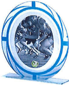
#157 | Targa circolare in cristallo con astuccio 19x19cm