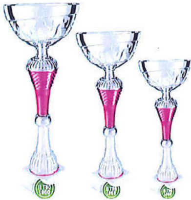
#181 | Coppa personalizzabile con inserto rosa h. 26,5cm/ 29,5cm/ 31cm