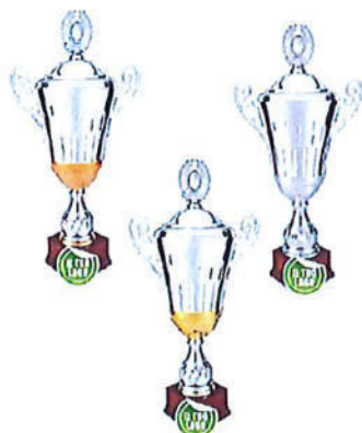
#197 | Coppa argenteo con coperchio personalizzabile, colori e misure disponibili: h. oro: 66cm h. argento: 58cm h. bronzo: 53cm