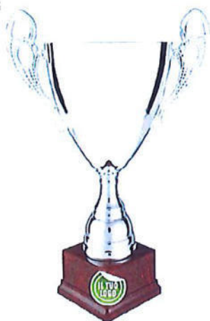
#190 | Trofeo con manici argenteo personalizzabile misure disponibili: 30 / 34 / 39 / 41 cm