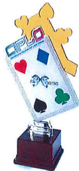
#162 | Trofeo in metallo e legno personalizzato