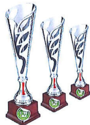
#189 | Trofeo personalizzabile, misure disponibili: 36 / 38 / 40 cm