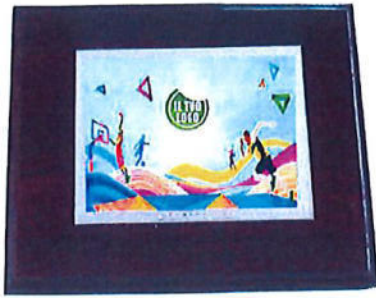
#154 | Targa su crest in legno con supporto 23x18cm