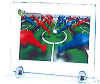
#156 | Targa in cristallo con astuccio 21X15cm