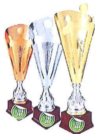
#204 | Trofeo con corona personalizzabile misure e colori disponibili: h. oro: 54cm / h. argento: 48,5cm / h. bronzo: 41,5cm