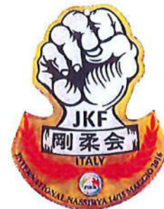
ESEMPIO DI PERSONALIZZAZIONE TAGLIO E STAMPA