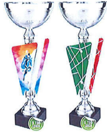
#183 | Coppa con pannello personalizzabile con disciplina sportiva/ tricolore/logo società, misure disponibili: h. 35/ 40 / 45cm