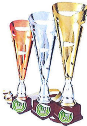
#200 | Trofeo personalizzabile, misure e colori disponibili: h oro: 50,5cm / h. argento: 46cm / h. bronzo: 40,5cm