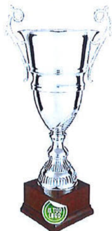
#205 | Trofeo personalizzabile, misure disponibili: h. 45 / 52 / 57cm