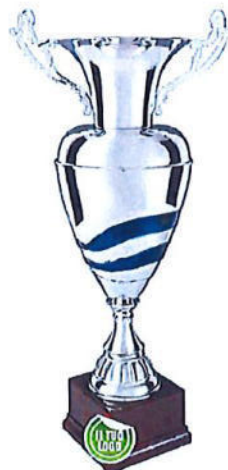
#206 | Trofeo personalizzabile, misure disponibili: 41,5 / 47 / 52 / 57 / 61,5 cm