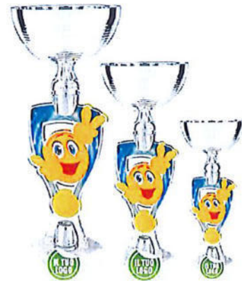
#186 | Coppa personalizzabile con logo società/evento, misure disponibili: 23 - 26 - 28cm