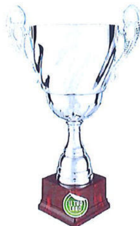
#192 | Trofeo argenteo con manici personalizzabile misure disponibili: 32,5 / 38,5 / 43 / 48 cm