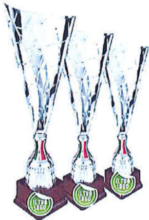
#199 | Trofeo personalizzabile misure disponibili: 41/ 44,5/ 51,5 cm