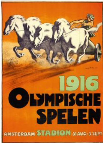
Locandina dei Giochi di Berlino del 1916

Fino ad oggi in 124 anni di vita solo le guerre avevano fermato i Giochi Olimpici dell'Era Moderna, la cui prima edizione si era svolta ad Atene nel 1896.