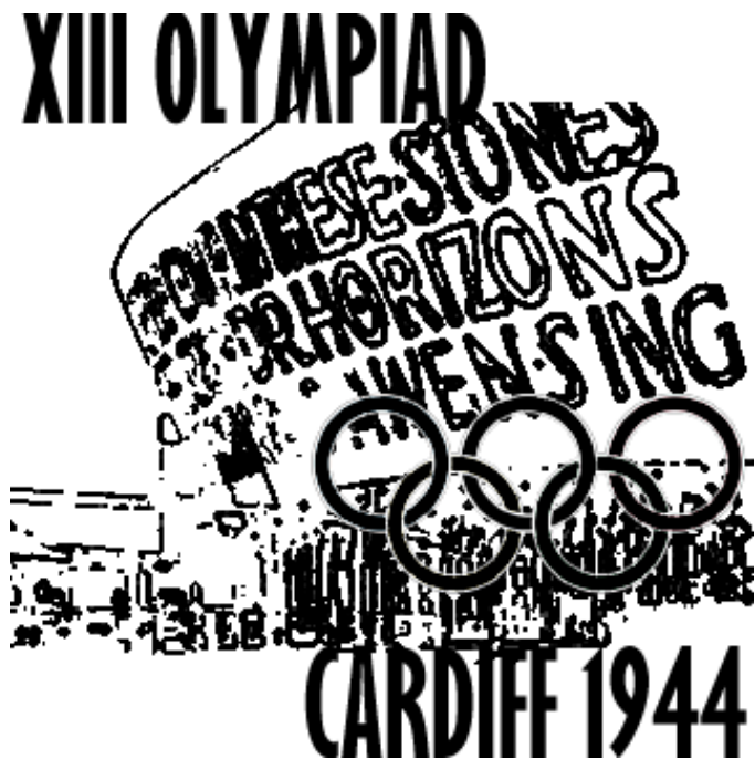
Locandina dei Giochi del 1944 poi soppressi

Non ostante la sessione del CIO del 1939 avesse visto prevalere Londra su Roma per la organizzazione dei XIII Giochi del 1944, questi non si disputarono per il protrarsi del conflitto mondiale, che terminò il 2 settembre del 1945.