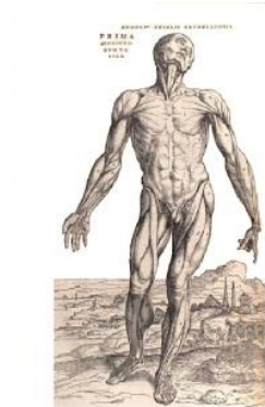
Centro Studi FIDAL Sicilia