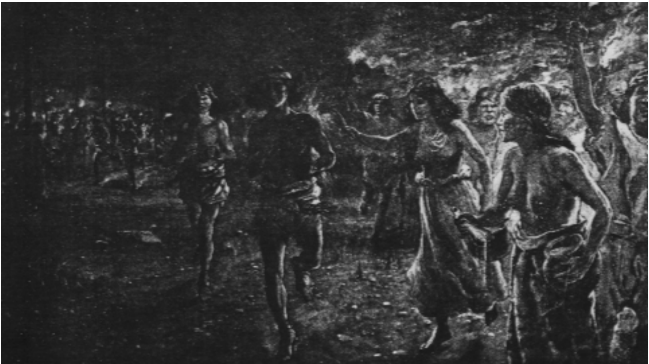
Figura 2 – Fase notturna di una gara di calcio-corsa tra i Rarámuri (fonte: Lumholtz 1902).