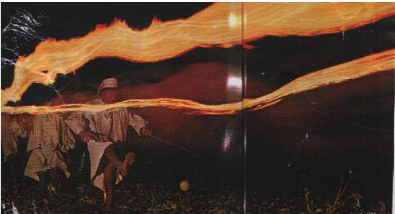
Figura 3 – Fotografia che documenta, molti anni dopo i disegni di Lumholtz, un momento notturno di una gara di calcio-corsa tra i Rarámuri.

Cosa rappresenta la croce? Lumholtz racconta che, in una occasione in cui ha chiesto conto del motivo per cui fossero state posizionate due croci piccole ed una grande, gli è stato spiegato che quella più imponente incarnava il Padre Sole. Ma narra anche che tra marzo e maggio si tiene una