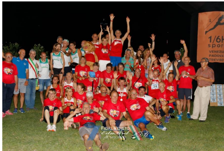
S. Biagio di C. 2019 Uomini: 1° Donne: 4° Combinata: 1°