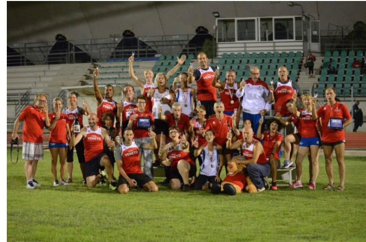
Misano A. 2018 Uomini: 3° Donne: 2°