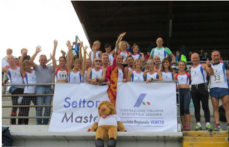
Salò, 2017 Uomini: 2° Donne: 4°