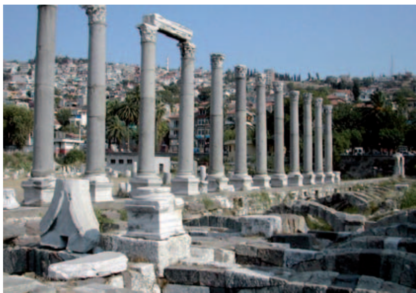
Una veduta dell'agorà di Smirne