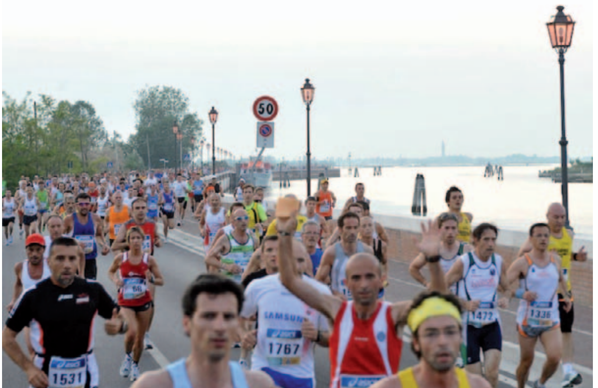
Da Cavallino a Jesolo: è la Moonlight Half Marathon

Infine, sempre grazie alla sensibilità della Confocommercio San Donà-Jesolo, atleti ed accompagnatori potranno usufruire anche quest'anno di speciali sconti del 10% in numerosissimi locali e ristoranti di Jesolo e Cavallino, grazie alla Party Card che verrà consegnata al ritiro del pettorale. Maggiori dettagli sono disponibili sul sito www.moonlighthalfmarathon.it .