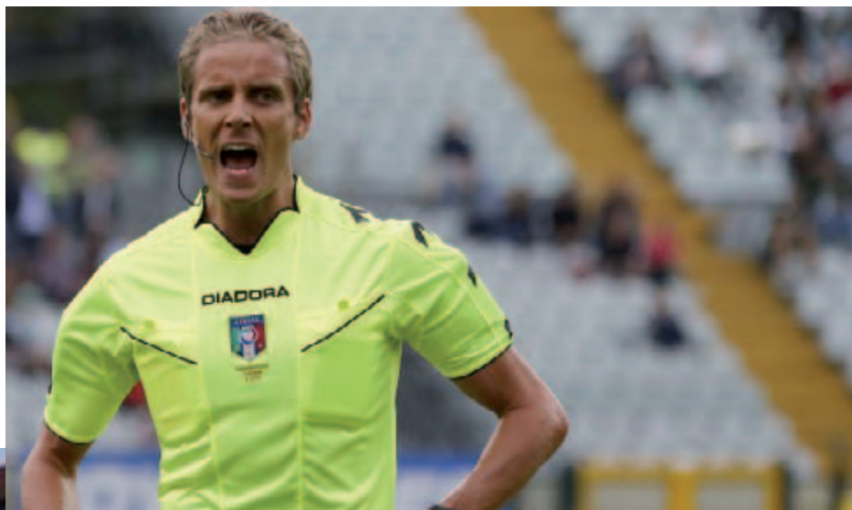
Chiffi in veste di arbitro: ora anche in serie A

Pressoché unanimi i giudizi positivi da parte della stampa specializzata sull'operato di