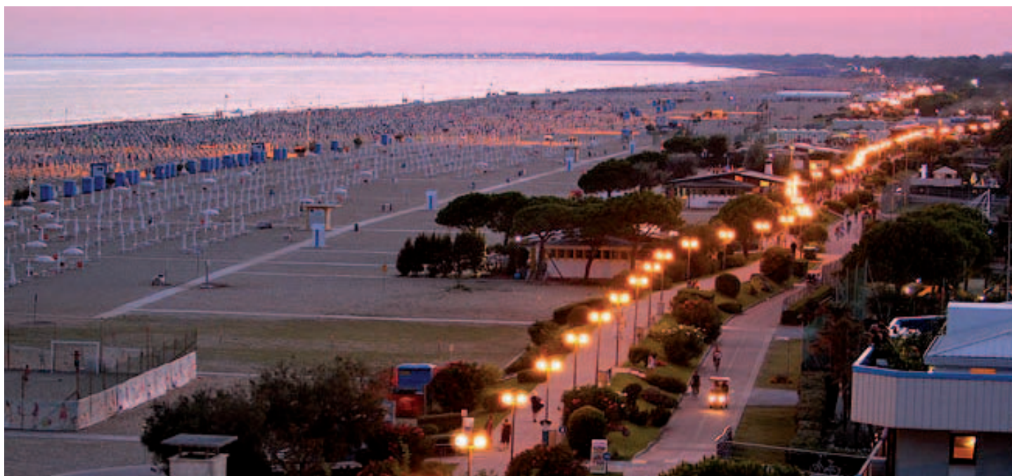
Una veduta di Bibione al tramonto

Il nome è già una meraviglia: “Bibione is surprising run”. Bibione, rinomata località turistica sulla costa veneziana, il prossimo 27 settembre, ospiterà l'edizione inaugurale di una corsa sulla distanza delle 10 miglia (16,094 km) che promette spettacolo e non mancherà di richiamare al via un gran numero di appassionati.