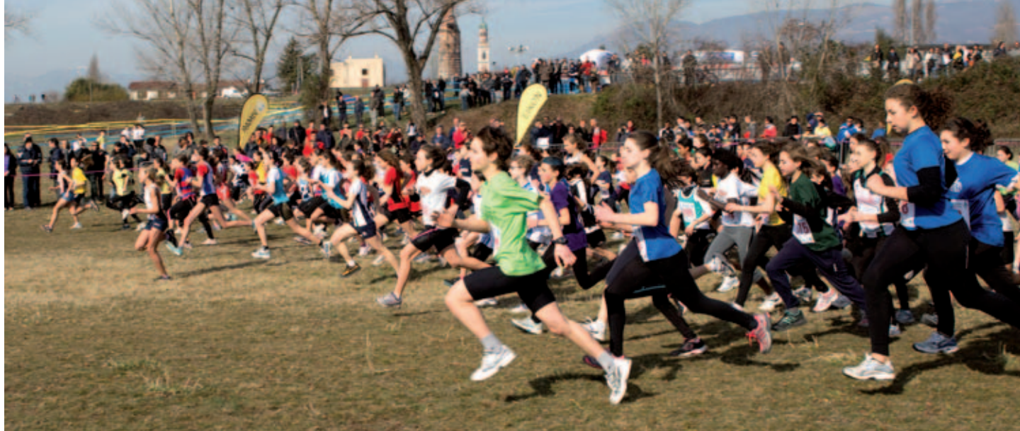
Novè sar  anche sede del campionato italiano cadetti