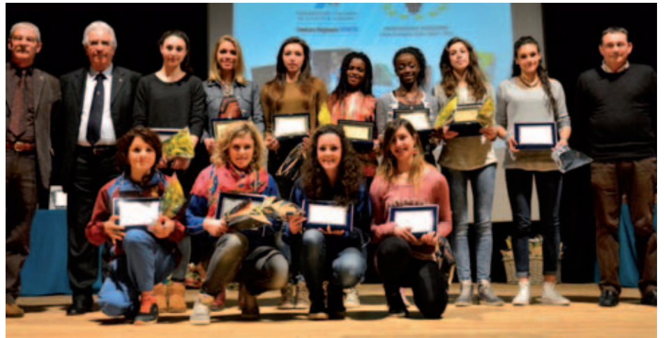
La premiazione del gruppo delle allieve