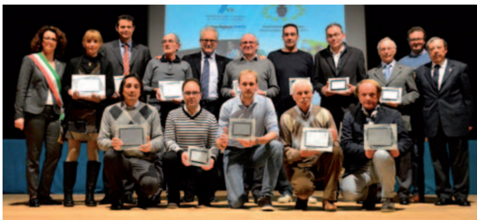
Le società premiate a Montecchio