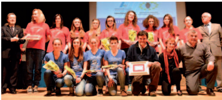
Gli istituti Lavarda di Breganze e Dal Piaz di Feltre