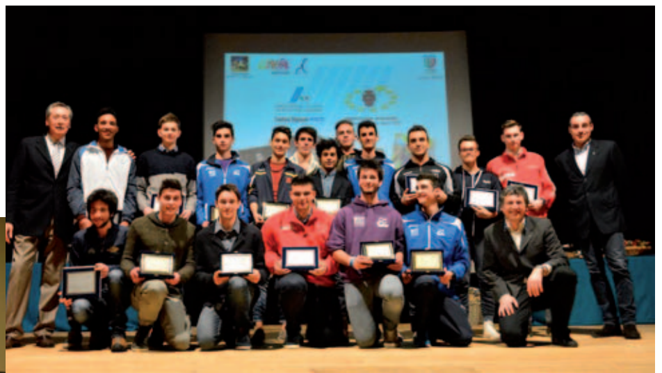
Foto di gruppo anche per gli under 18