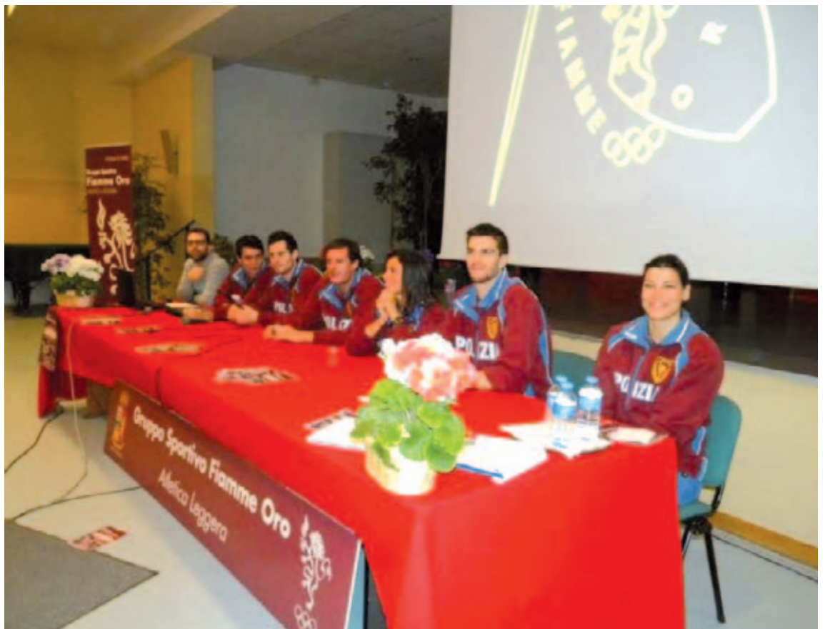
Gli atleti delle Fiamme Oro alla tavola rotonda di Monselice