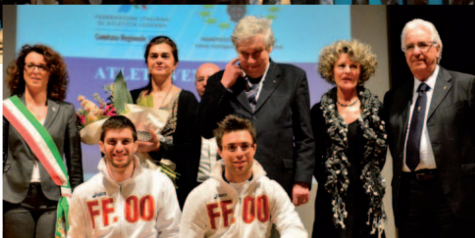
Riconoscimenti speciali per Tumi e Chesani

Poi consueta vetrina per le società, le scuole, i dirigenti, i tecnici, i giudici di gara. Un grande 2013 è in archivio, ma il 2014 promette altrettanto. E anche di meglio.