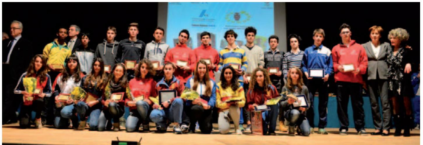
I cadetti protagonisti ai Tricolori di Jesolo

l'atletica azzurra del passato. Due madrine d'eccezione, con un curriculum impreziosito da titoli olimpici, mondiali ed europei, per una passerella che, come sempre, ha rappresentato