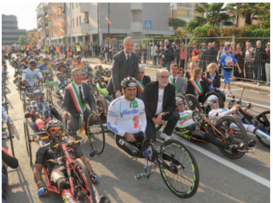
Alex Zanardi, un grande amico della Maratona S. Antonio

Il nuovo percorso da Campodarsego a Padova, lo ricordiamo, ha ottenuto la certificazione internazionale di Aims (Association of International Marathons and Distance Races) e IAAF nel 2011, per un evento che nella sua storia ha visto siglare in Prato della Valle ben cinque record mondiali, tra cui quello firmato dalla già citata Francesca Porcellato nel 2005 (paraplegici T53 - un'ora 38'29").