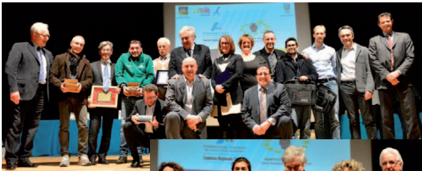
Passerella anche per tecnici e giudici di gara

la perfetta sintesi dell'attività di un movimento veneto tra i più vivaci nel panorama dell'atletica nazionale.