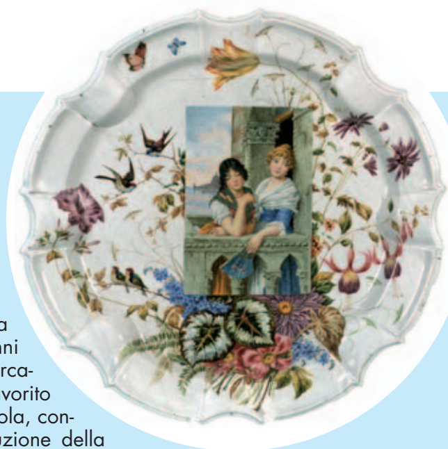
Nove è la terra della ceramica artistica

Per le giornate dell'8 e 9 marzo il museo civico della ceramica rimarrà aperto in orario continuato dalla 9 alle 19, con ingresso ridotto a 3 euro.