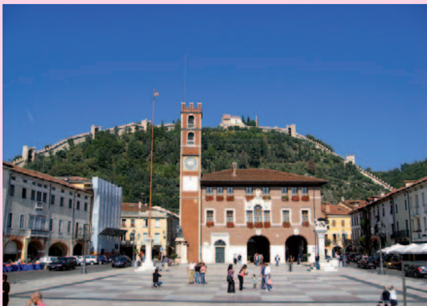
Marostica, la città degli scacchi

Marostica esprime molte eccellenze: più di quaranta associazioni culturali e altrettante realtà sportive, una profonda tradizione musicale e il concorso internazionale di grafica "Umoristi a Marostica" giunto alla 46 a edizione; senza contare gli innumerevoli percorsi naturalistici da gustare con calma assieme ai prodotti tipici: dall'olio alla "Ciliegia Igp di Marostica" e, perché no, anche una tazza di buon caffè, dato che Prospero Alpini, botanico del 1500 che per primo portò in Europa la pianta del caffè, nacque ed abitò proprio a Marostica.