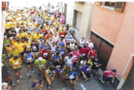
PARTENZA EDIZIONE 2014

Dopo la gara vi è la possibilità per i concorrenti e gli accompagnatori di PRANZARE presso il campo sportivo/area manifestazioni.