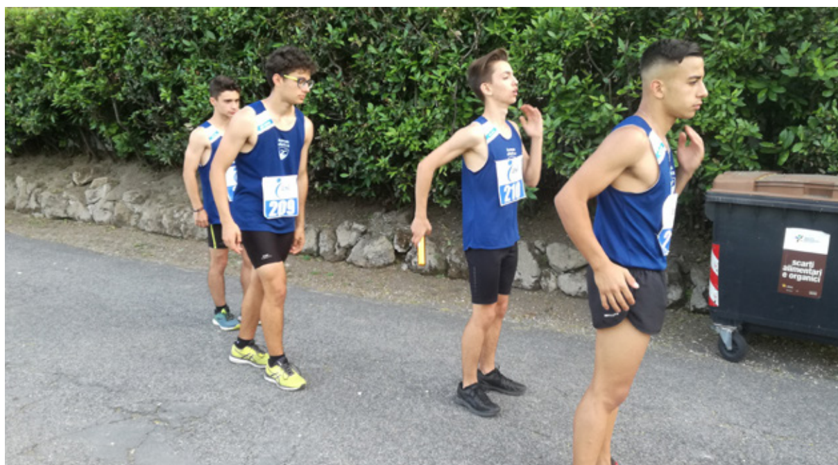
ESERCIZI DI RISCALDAMENTO PRIMA DELLA STAFFETTA DI MARCIA