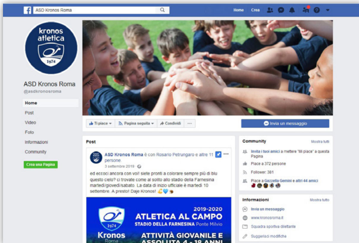
FACEBOOK ASD KRONOS ROMA